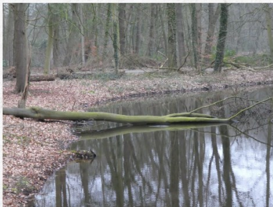
Der erste Baum im Langteich -