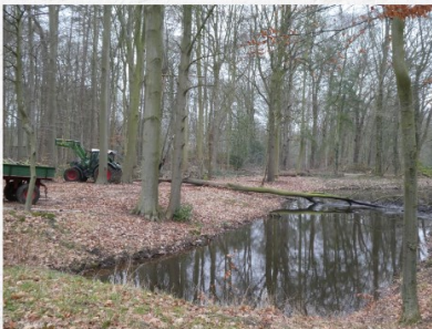
der Baum wird entfernt -